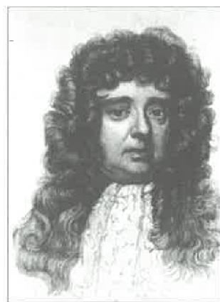
Bal felső saroktól kiindulva az óramutató szerint: Arisztotelész, Aquinói Szent Tamás, William Petty, François Quesnay